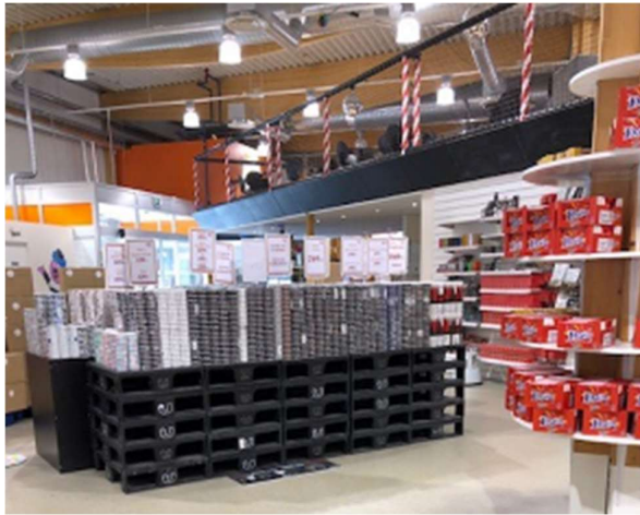
2. kuva kuvassa 3

2. Kuva on Haaparannan ja Tornion rajalla olevasta Candy World -kaupasta, jossa myydään karkkia ja nuuskaa. Nuuskat on aseteltu karkkihyllyjen viereen. (Haaparanta on Ruotsin ja Suomen rajalla).