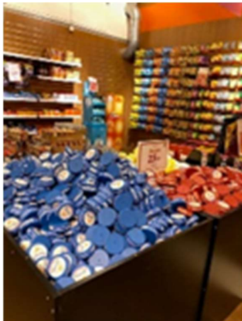
3. kuva kuvassa 3.

2. Kuva on Haaparannan ja Tornion rajalla olevasta Candy World -kaupasta, jossa myydään karkkia ja nuuskaa. Nuuskat on aseteltu karkkihyllyjen viereen. (Haaparanta on Ruotsin ja Suomen rajalla).