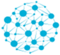
MAAKUNNALLISEN YHTEISTYÖVERKOSTON KOONTI