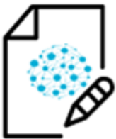
PALVELUVERKOSTON KARTOITUS, KUVAUS JA OPTIMOINTI

Yhteistoiminnallinen kouluttautuminen ja toiminnan kehittäminen