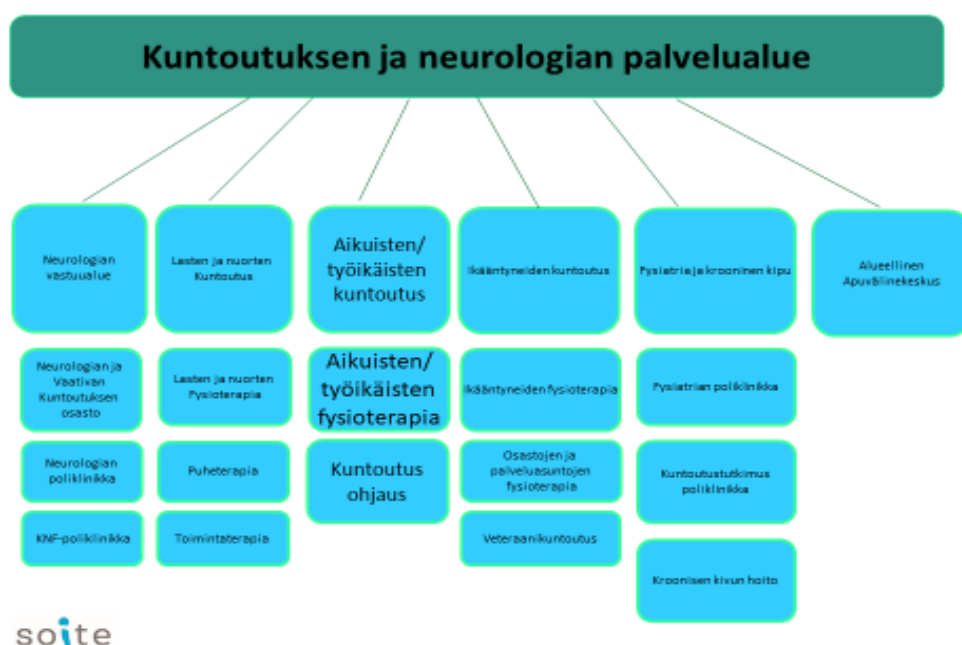
Taulukko: Kuntoutuksen ja neurologian palvelualue Soitessa

Vuonna 2019 kuntoutuspalveluihin tuli toiminta- ja työkykyarvioita varten läheteet 71:stä potilaasta, joista 36 tuli oman sairaalan joltain erikoisalalta ja terveyskeskuksesta 28 kpl.