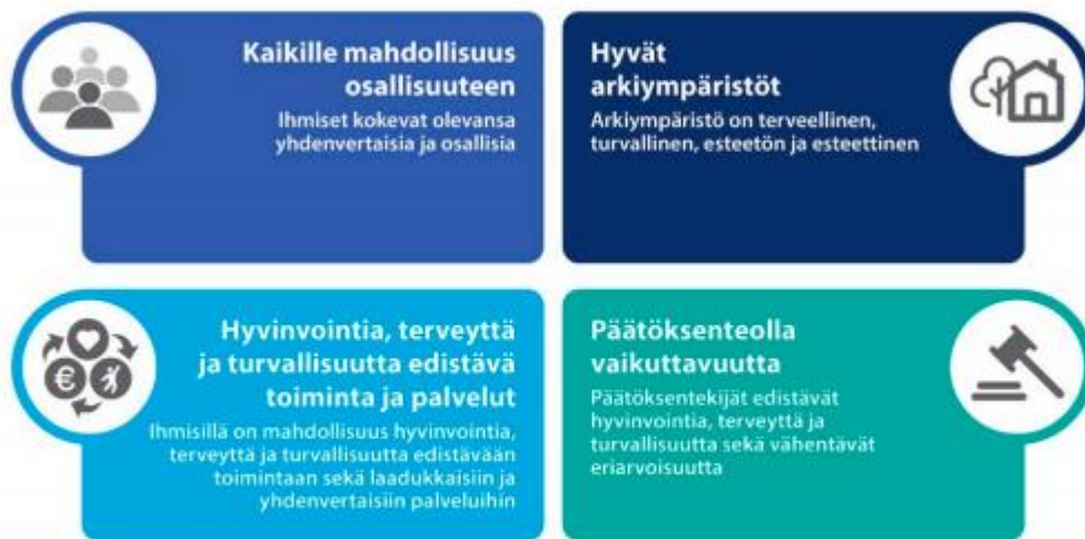
Kuva 1 Hyvinvoinnin, terveyden ja turvallisuuden edistäminen 2030 painopisteet (STM)

Keski-Suomen hyvinvointiohjelmassa on pyritty ottamaan huomioon huhtikuussa 2021 julkistetun hyvinvoinnin, terveyden ja turvallisuuden edistämisen 2030 toimeenpanosuunnitelman 1 isoja linjoja (kuva 1). Kansalliset painotukset kohdentuvat osallisuuteen, arkiympäristön toimivuuteen ja terveellisyteen, laadukkaisiin palveluihin sekä hyvinvoinnin huomioimiseen päätöksenteossa.