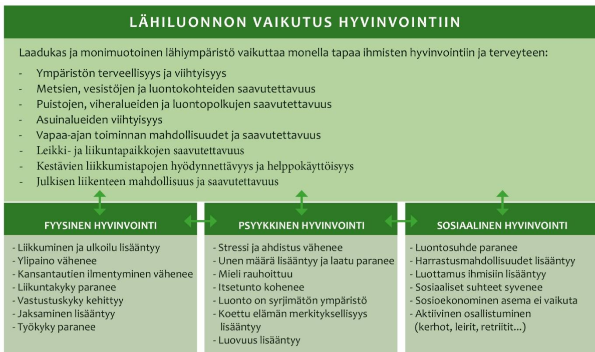
Kuva 3 Lähiluonnon vaikutus hyvinvointiin

Fyysisen liikkumisen helpottaminen lähiympäristössä on merkittävää, sillä se edistää terveyttä ja hyvinvointia, mutta lisää myös mahdollisuuksia kestäviin liikkumismuotoihin. Kestävämmät liikkumismuodot vähentävät tarvetta autoilulle sekä autoiluun suunnitellulle infrastruktuurille. Tämä lisää turvallisuutta, kohentaa ilmanlaatua sekä vähentää melua lisäten mahdollisuuksia ja halua liikkua ulkona ja myös tätä kautta vaikuttaa positiivisesti terveyteen. Tarkemmat tavoitteet on esitelty taulukossa 5.