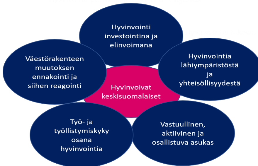
Kuva 2 Hyvinvointiohjelman painopisteet

Ohjelma korostaa työikäisten työ- ja työllistymiskykyä. Työssä jaksaminen ja mielenterveyden ongelmat ajavat useita ennen aikaiselle eläkkeelle sekä sairauslomille. Hyvä työkyky alkaa rakentua jo opiskeluaikana muodostuvilla elämäntavoilla ja työelämävalmiuksilla. Meidän pitää myös varautua väestörakenteen ja syntyvyyden laskun aiheuttamiin muutoksiin palveluissa sekä työvoiman saannin haasteena. Paine työurien pidentämiselle kasvaa tulevina vuosina.