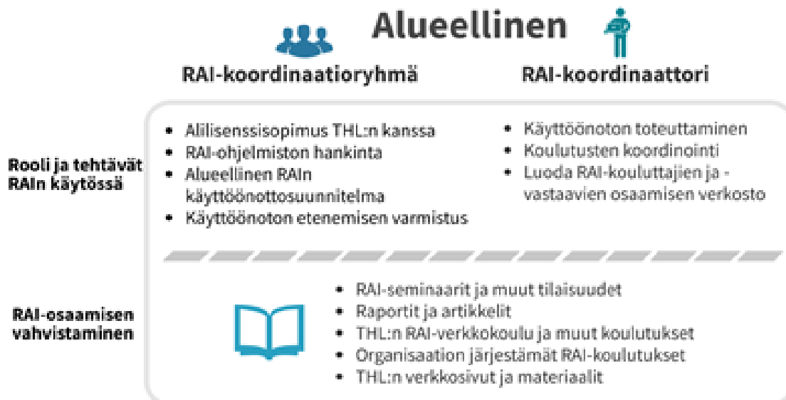
Kuvio 2. Alueellisen RAI-koordinaatioryhmän ja RAI-koordinaattorin roolit RAI:n käytössä.