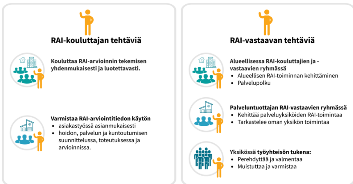
Kuvio 2. RAI-kouluttajan ja -vastaavan rooli ja tehtävät RAI:n käytössä.

Omassa yksikössään RAI-vastaava toimii työyhteisön tukena perehdyttäen ja valmentaa sekä myös muistuttaen ja varmistaa asiakkaan RAI-arvioinnin ja siitä saatavan tiedon hyödyntämistä palvelujen ja hoidon suunnittelussa ja toteutuksessa.