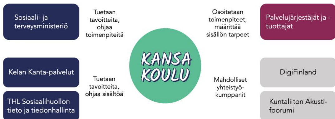
Kuvio 2. Sidosryhmät ja niiden suhde hankkeeseen.

THL:n Sosiaalihuollon tieto ja tiedonhallinta -tiimi on hankkeelle merkittävä sidosryhmä. Hankkeen käyttämien tietosisältöjen ajantasaisuuden ja oikeellisuuden varmistamiseksi hanke tekee yhteistyötä tiimin asiantuntijoiden kanssa. Tiivis yhteistyö on tarpeen, jotta voidaan varmistaa, että hankkeella on käytettävissään uusimmat sosiaalihuollon palvelutuotannon toiminnallisiin määrittelyihin, asiakastietomalliin ja sosiaalihuollon asiakastiedon kirjaamisessa käytettäviin luokituksiin liittyvät määrittelyt ja ohjeet sekä suomeksi että ruotsiksi.