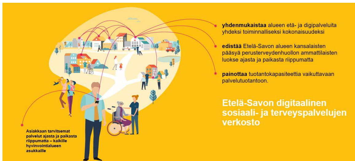
Kuva 1 Etelä-Savon digitaalinen sosiaali- ja terveystalvelujen verkosto

Kuvassa 1 on konseptikuva Etelä-Savon digitaalisesta sosiaali- ja terveystalvelujen verkostosta.