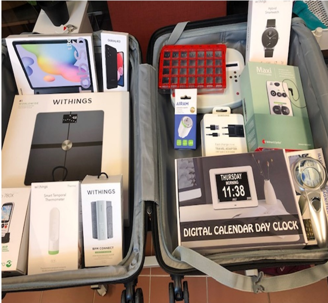
Lainattava Laitelaukku PirKATI 2022