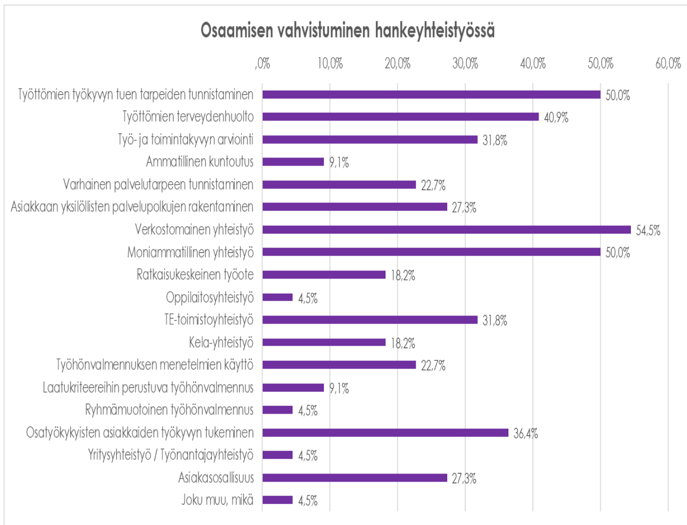
Taulukko 1. Osaamisen vahvistuminen hankeyhteistyössä.

Avoimeen vastaukseen oli vastattu, että hankeyhteistyössä oli vahvistunut monialaisen verkoston tunnistaminen.