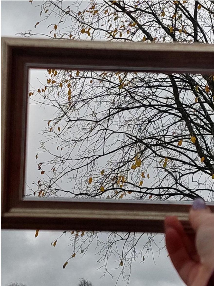
Taideteos tunteesta suru