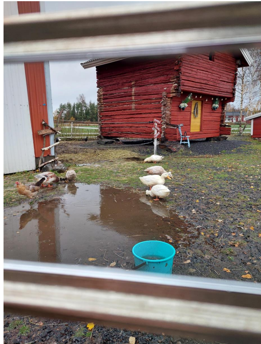
Taideteos tunteesta ilo