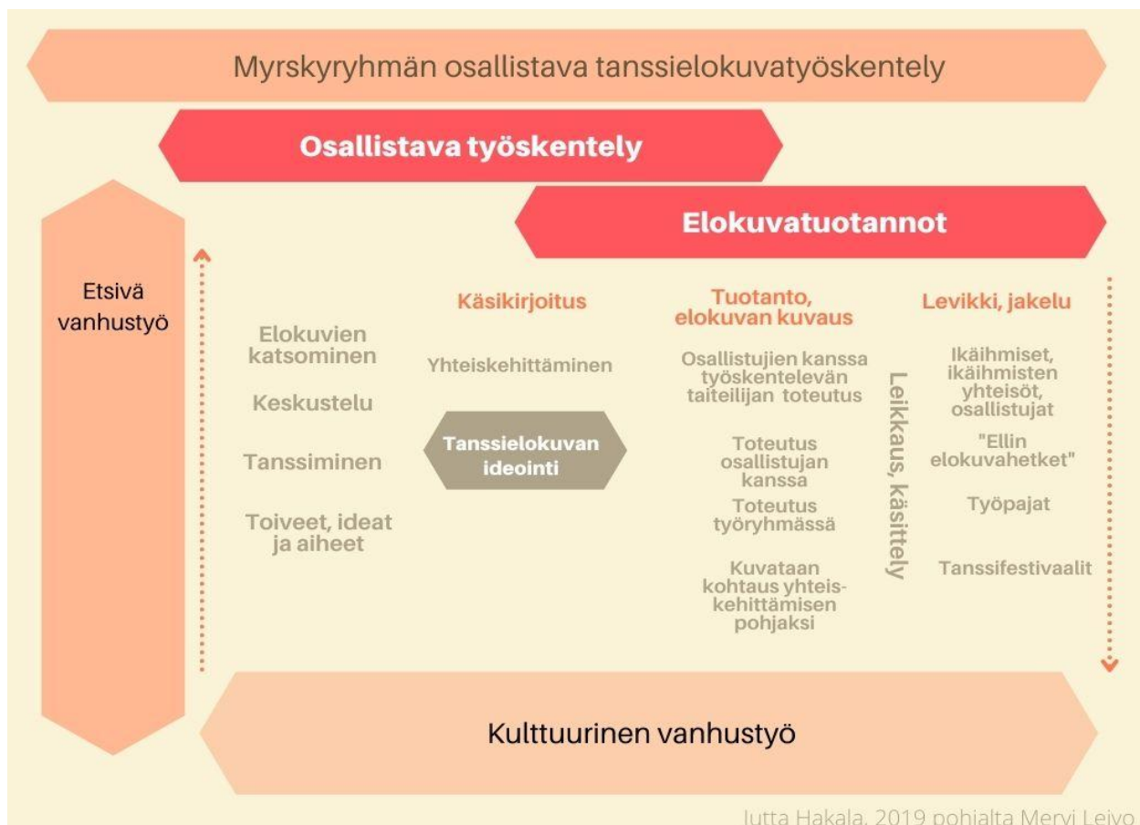
Kuvio osallistavan tanssielokuvatyöskentelyn kokonaisuudesta.

Lähde: Hakala, Jutta (2019). Hyvän päivän ylistys: Hyvinvointia ikäihmisille tanssielokuvan keinoin. Opinnäytetyö. Kulttuurituotanto YAMK. Humanistinen ammattikorkeakoulu. https://www.theseus.fi/handle/10024/267127 / http://urn.fi/URN:NBN:fi:amk-2019121827435 viitattu 15.7.2021