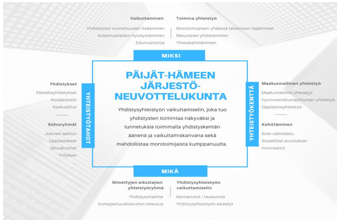
Kuva 1. Kuva Päijät-Hämeen järjestöneuvottelukunnan roolista ja tehtävistä.

Järjestöneuvottelukunta on yhdistysyhteistyön vaikuttamistoimielin, joka tuo yhdistysten toimintaa näkyväksi ja tunnetuksi toimimalla yhdistyskentän äänenä ja vaikuttamiskanavana sekä mahdollistaa monitoimijaista kumppanuutta. Järjestöneuvottelukunnan tehtävänä on edistää järjestöjen toimintaedellytyksiä ja vaikuttamismahdollisuuksia sekä lisätä yhteiskehittämistä ja kumppanuutta hyvinvoinnin, terveyden ja turvallisuuden edistämiseksi. Aluehallitus asettaa neuvottelukunnan ja päättää sen kokoonpanosta. Yhdyspintaneuvottelukunnan tehtävänä on edistää hyteen liittyvää yhteistyötä alueella, edustus: kunnat, hyvinvointialue, maakuntaliitto sekä järjestöedustajat järjestöneuvottelukunnasta.