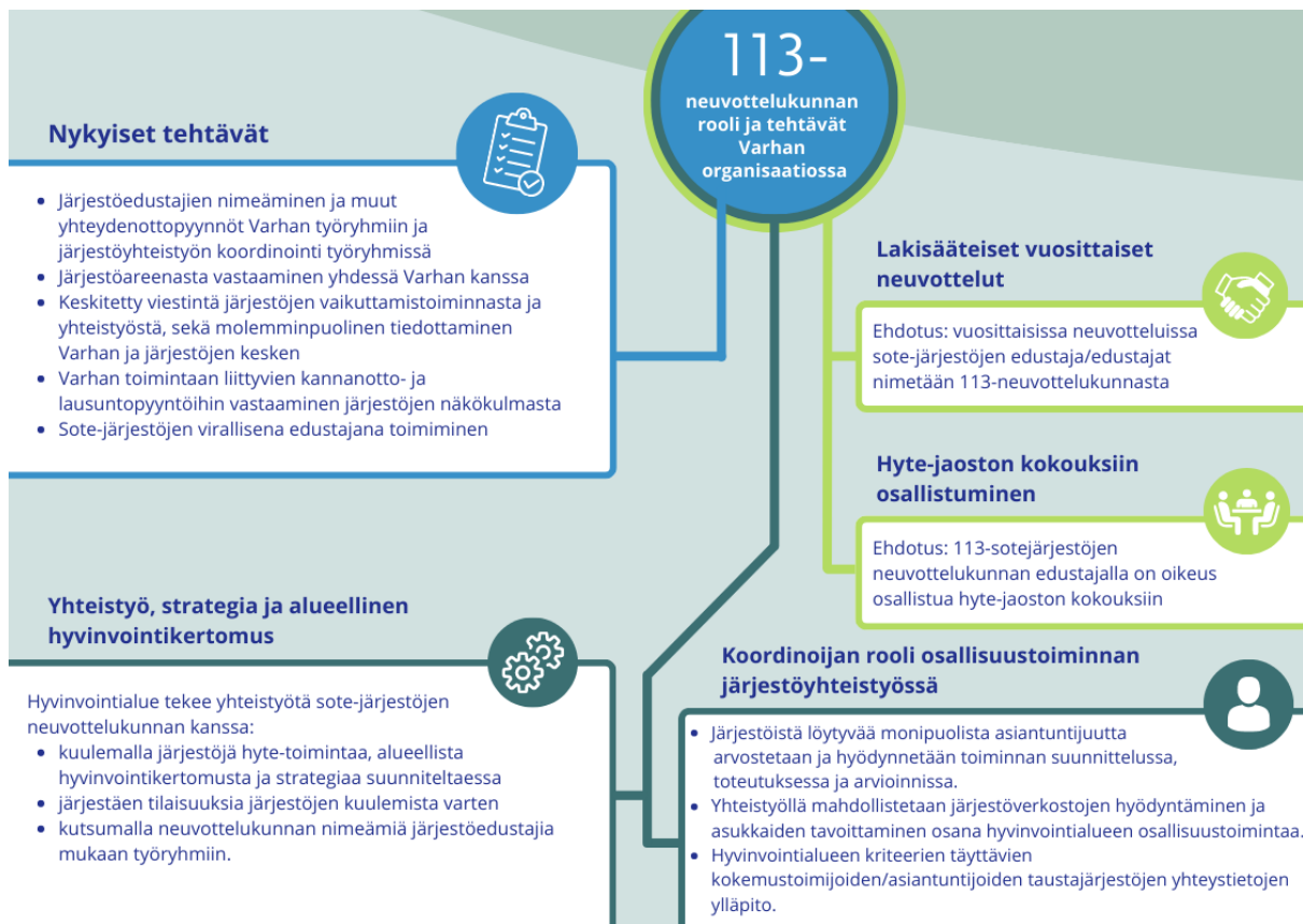
Kuva 3. Esitys 113-neuvottelukunnan roolista ja tehtävistä Varhan organisaatiossa