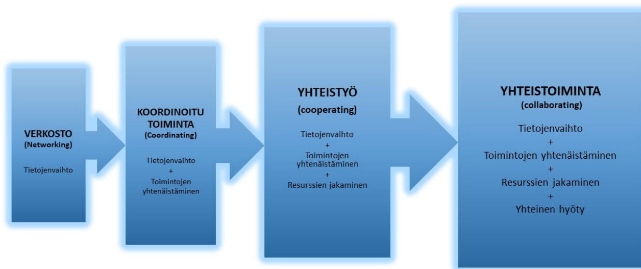
Kuva 1. Arthur Himmelmanin luokittelu yhteistoiminnasta. Alkuperäinen lähde: Himmelman, A. 2002. Collaboration for a Change. Definitions, Decision-making models, Roles, and Collaboration Process.

yhteiseen resurssien panostukseen, riskinottoon ja korkeaan luottamustasoon. Kaikki luokittelun tasot ovat yhtä arvokkaita ja jokaiselle yhteistyön muodolle on oma tarkoituksensa ja paikkansa. Jäsennyksen keskiössä ovat aika, luottamus ja asiantuntemus. Niiden jakaminen määrittelee yhteistyön tason. (Himmelman, 2002, s. 2).