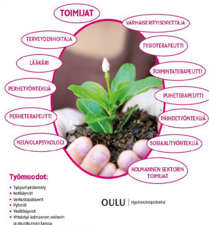
Kuva 4. Hyvinvointineuvolan toimintamalli