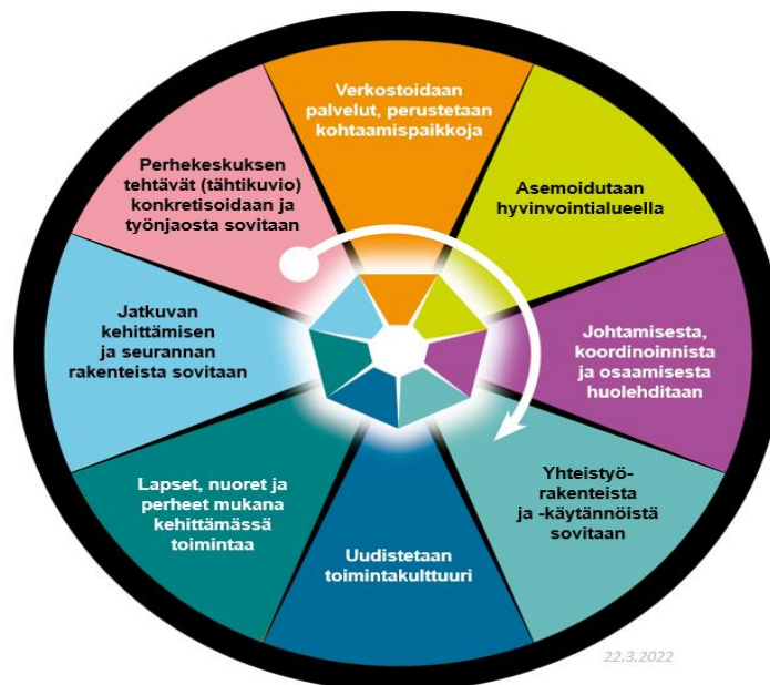
Kuva1. Perhekeskustoiminnan kansalliset linjaukset

Perhekeskuksen palvelut on tarkoitettu kaikille lapsille, nuorille ja perheille: lasta odottavat perheet, alle kouluikäiset lapset ja heidän vanhempansa, kouluikäiset lapset ja heidän perheensä sekä 16-vuotiaat ja sitä vanhemmat lapset, nuoret ja heidän perheensä. Perhekeskuksen palvelut tarjotaan toimipisteissä koottuna yhteen tai erillisinä, sähköisesti ja kotiin tai lasten kasvuympäristöön vietyinä. Toimipisteet voivat sijaista esim. päiväkodin, koulun, monitoimitilan tai sosiaali- ja terveysaseman yhteydessä tai erillisessä kiinteistössä tai omassa rakennuksessa. Vaikka palveluita kootaan yhteen toimipisteeseen, niin perhekeskus toimii ainakin osin verkostomaisesti.