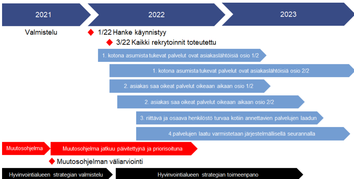
Kuva 2. Aikataulusuunnitelma rahoituksella toteutettavista toimenpiteistä.