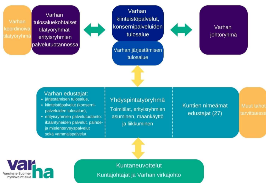
Kuvio 2. Varhan sisäiset rakenteet ja tiedonkulku Toimitilat, erityisryhmien asuminen, maankäyttö ja liikkuminen – yhdyspintatyöryhmän työskentelyn tukena.

Kuntia (27 kpl) on pyydetty nimeämään edustajansa yhdyspintatyöryhmään. Varhan edustajat työryhmään tulevat järjestämisen tulosalueelta, kiinteistöpalveluista (konsernipalveluiden tulosalue) sekä erityisryhmien palvelutuotannosta (ikäntyneiden palvelut, vammaispalvelu sekä päihde- ja mielenterveyspalvelut). Työskentelytapana ovat yhteistyöverkosto, sähköpostiryhmä ja tapaamiset 2-4 kertaa vuodessa.