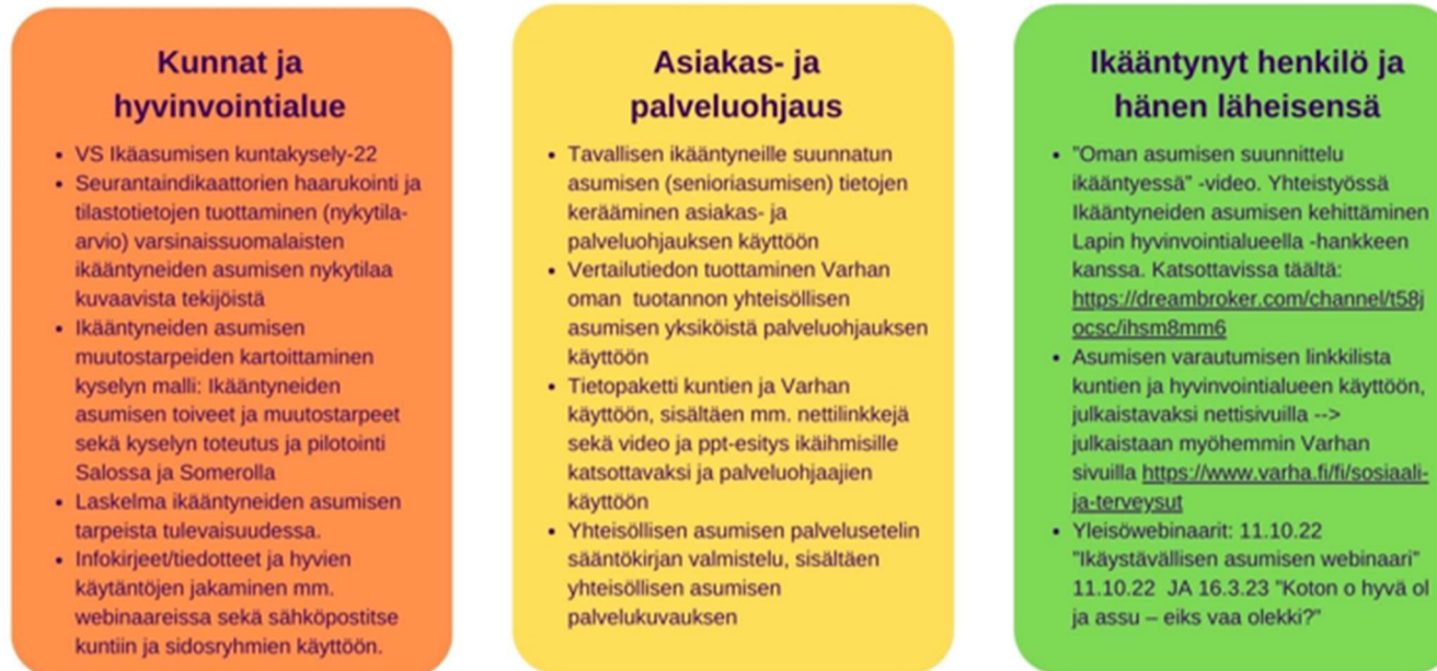
Kuvio 3. VS Ikäasumisen hankkeessa tuotettu ikääntyneiden asumisen ennakkointia ja varautumista koskeva tieto eri kohderyhmien käyttöön.

VS Ikäasumisen hankkeessa oli tavoitteena tuottaa tietoa ikääntyneiden asumisen ennakkoinnin ja varautumisen vahvistamiseksi kuntien ja hyvinvointialueen sekä ikääntyneen henkilön ja hänen läheistensä käyttöön. Tietoa kerättiin ja tuotettiin eri muodoissa. Kuntia ja hyvinvointialuetta koskeva tieto on sellaista, mitä voidaan tulevaisuudessa hyödyntää ikääntyneiden asumisen tarpeiden suunnittelun tukena (mm. kyselyjen tulokset, tilastotiedot ja peittävyyslaskelmat). Asiakas- ja palveluohjauksen henkilöstö hyötyy asumisen vaihtoehtoja koskevasta tiedosta ja tietopaketeista. Myös ikääntyneitä hyödyttää tietopakettiin kootut tiedot, kunhan ne saadaan julkisesti nähtäville mm. Varhan internet-sivuille ja välillisesti myös palveluohjauksen kautta.