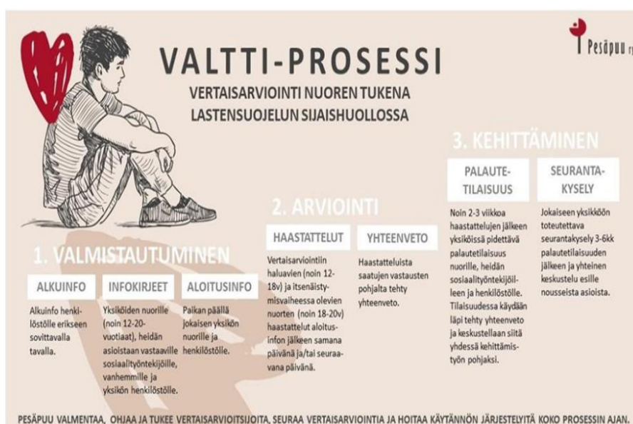
Kuvio 3. Valtti-prosessi