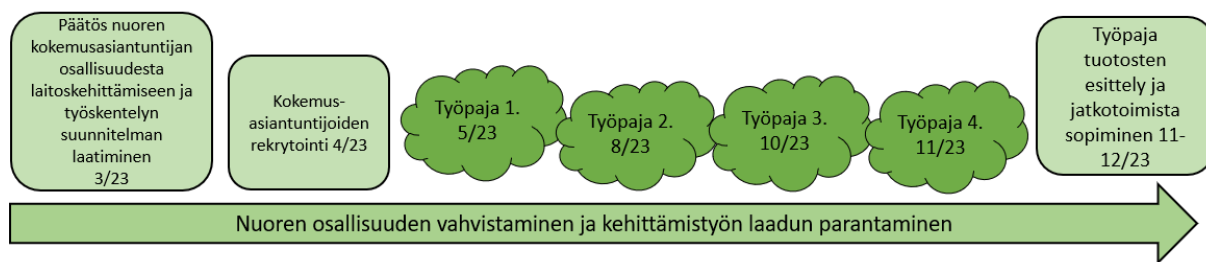
Kuvio 1. Työpajatyöskentelyn prosessi.