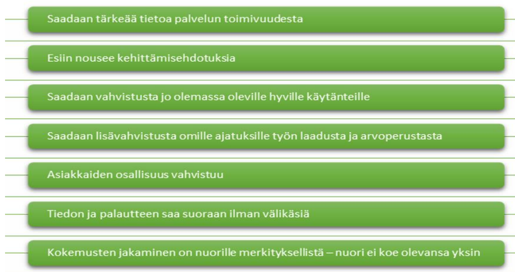
Kuvio 4. Vertaisarvioinnin hyödyt työntekijöiden kokemana. (Heino ym. 2021, 48–49.)