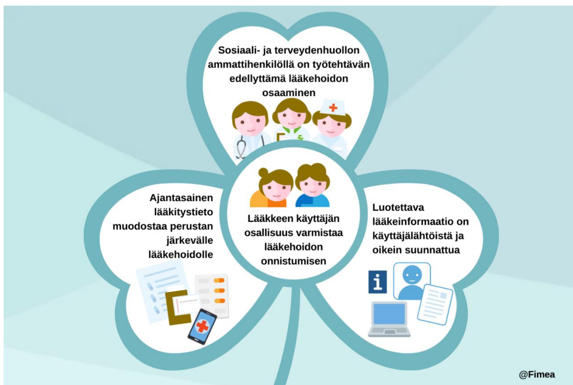
Kuva 1. Lääkeinformaatiostrategian 2021-2026 tavoitteet.

Lääkeinformaatioverkoston toiminnan perustana on Lääkkeen käyttäjä lääkeinformaation keskiöön – Kansallinen lääkeinformaatiostrategia 2021–2026, sen tavoitteet, päämäärä, toiminta-ajatus ja arvot sekä strategiaan kirjatut toimenpiteet Lääkeinformaatioverkostolle ( Lääkealan turvallisuus- ja kehittämiskeskus Fimea 2021 ).