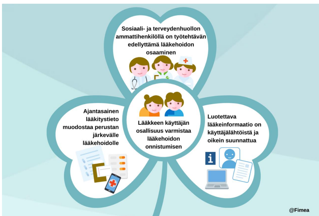
Kuva 1. Lääkeinformaatiostrategian 2021-2026 tavoitteet.

Lääkeinformaatioverkoston toiminnan perustana on Lääkkeen käyttäjä lääkeinformaation keskiöön – Kansallinen lääkeinformaatiostrategia 2021–2026, sen tavoitteet, päämäärä, toiminta-ajatus ja arvot sekä strategiaan kirjatut toimenpiteet Lääkeinformaatioverkostolle ( Lääkealan turvallisuus- ja kehittämiskeskus Fimea 2021 ).