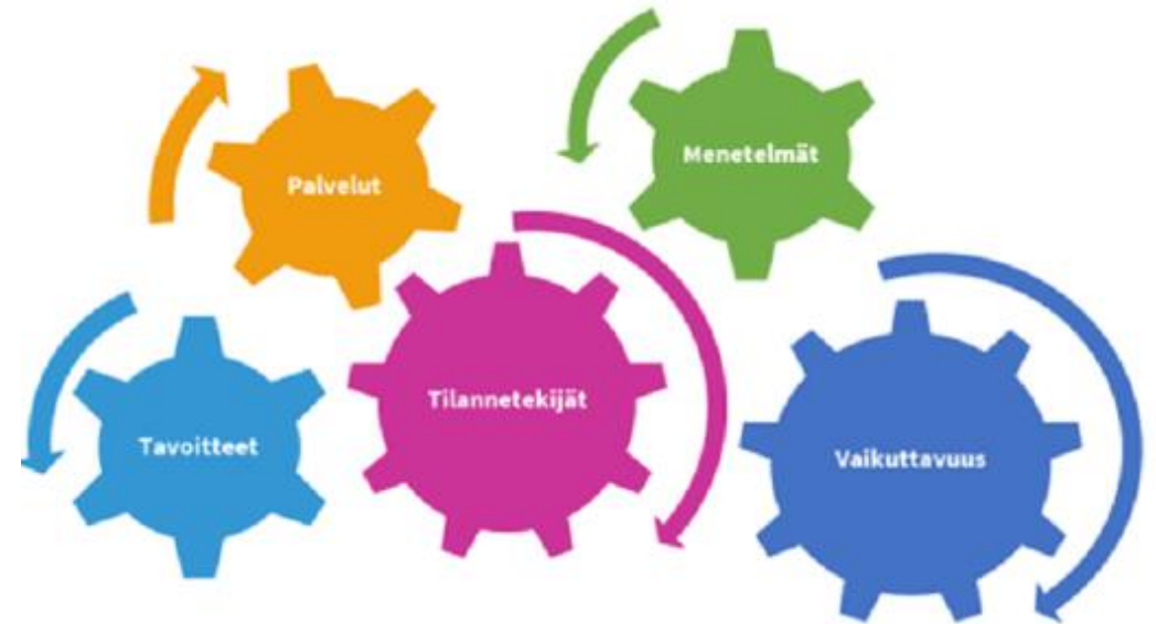
Kuvio: AVAIN-mittarin taustalla oleva käsitys vaikuttavuuden syntymisestä