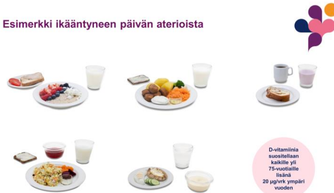
Esimerkki ikääntyneen päivän aterioista

D-vitamiinia suositellaan kaikille yli 75-vuotiaalle lisänä 20 µg/vrk ympäri vuoden