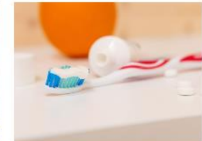
Suun terveydenhoito →