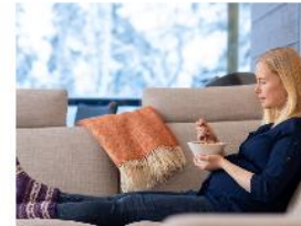
Raskaana olevat ja imettävät →

Eri ikäkausien ja tilanteiden ravitsemusohjausmateriaalit