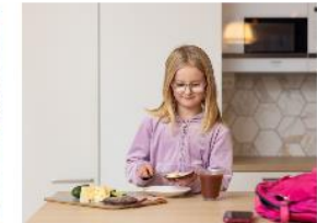
Kouluikäiset lapset →