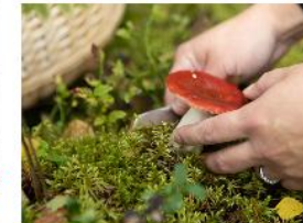
Kasvis- ja vegaaniruokavaliot →