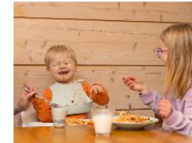
Neuvolaikäiset lapset →