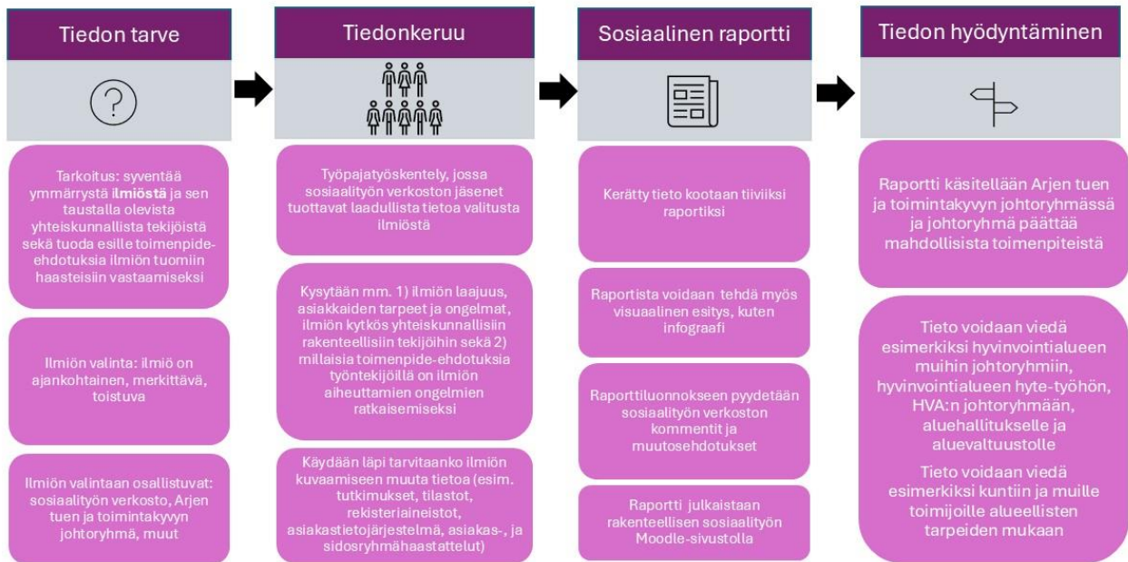
Ilmiölähtöisen sosiaalisen raportoinnin tiedonkulun prosessi (Liite 2)