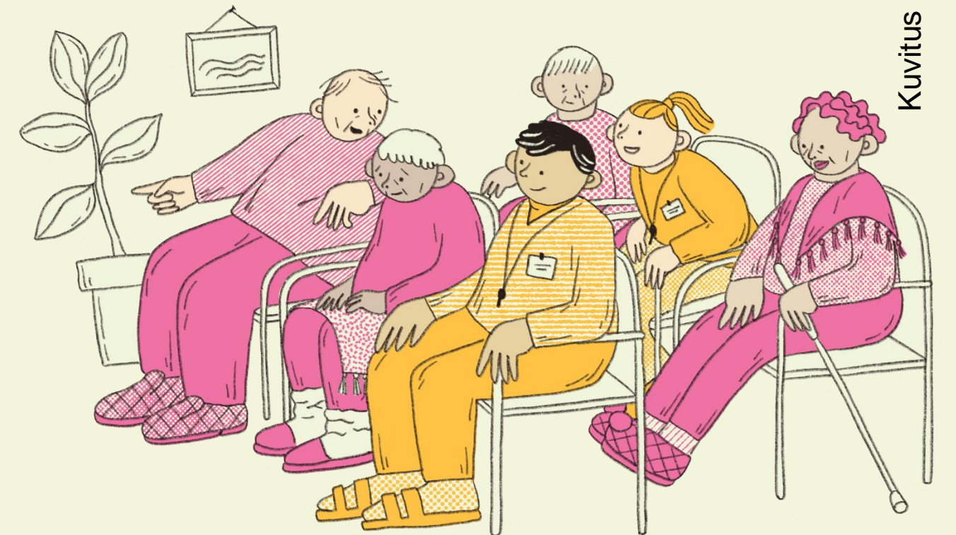
Kuvitus Elina Johanna Ahonen

https://thl.fi/aiheet/hyvinvoinnin-ja-terveyden-edistamisen-johtaminen/tieto-ja-toimintamallit/hyte-toimintamallien-arviointi/arvioidut-toimintamallit