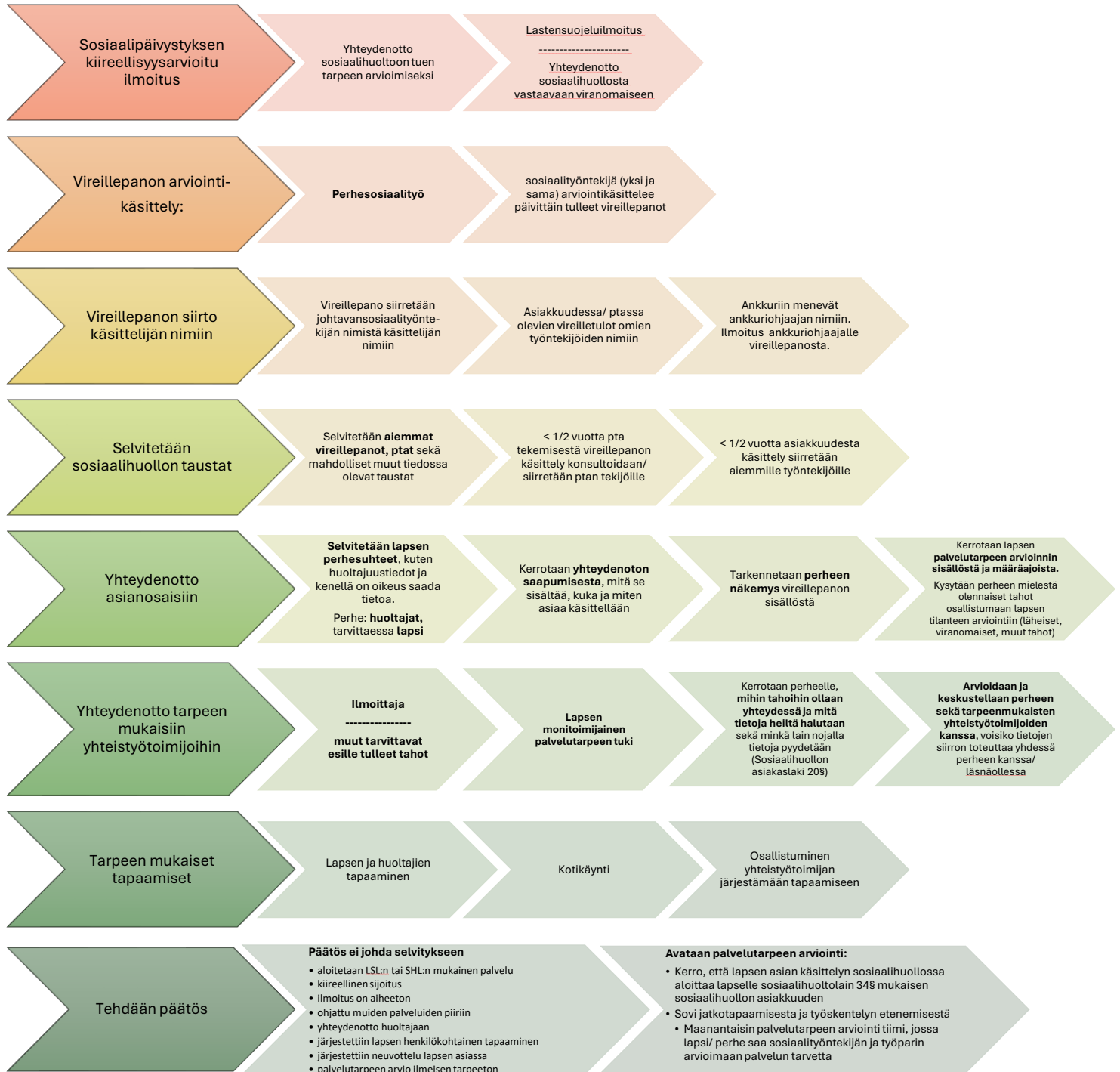
kuva: Yhteydenotto sosiaalihuollosta vastaavaan viranomaiseen/ lastensuojeluilmoitus vireillepanon käsittely -prosessin toimintamalli

Lisäksi on tehtävä sosiaalihuoltolain 36§:n mukainen palvelutarpeen arviointi. Arviointia ei tarvitse tehdä, jos se on ilmeisen tarpeeton. Arviointi voidaan jättää tekemättä myös silloin, kun on ilmeistä, ettei henkilö tule jatkossa tarvitsemaan sosiaalipalveluja.