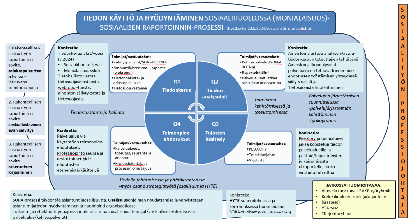
Kuva 1. Sosiaalisen raportoinnin prosessi, hyväksytty 20.5.2024.

Sosiaalisen raportoinnin prosesseja ja työvälineitä on kansallisella tasolla kehitetty vastaamaan SHL (1301/2014) 7§:n tiedontuotannollisiin velvoitteisiin, lisäämään